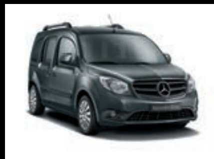
Šedá tenorit, metalíza MB 7755