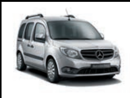
Stříbrná brilliant, metalíza MB 9744