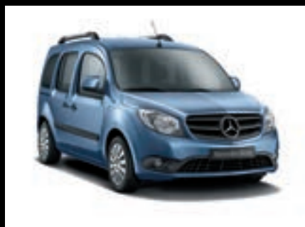
Modrá kornelit, metalíza MB 5581