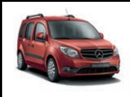
Červená bornit, metalíza MB 3276