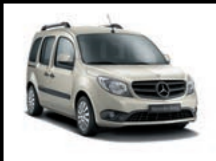
Šedá pebble MB 7701