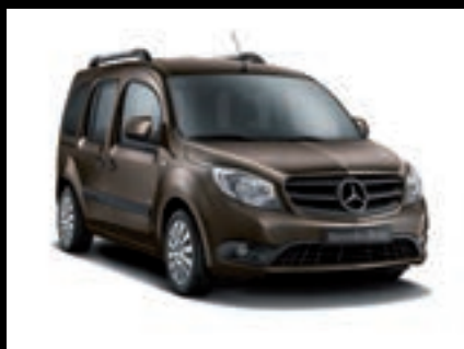
Hnědá limonit, metalíza MB 8566