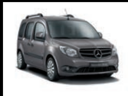
Šedá dolphin MB 7274