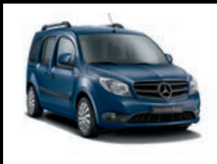
Modrá ink MB 5292