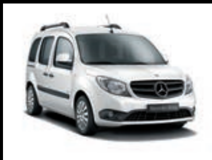
Bílá arctic MB 9147