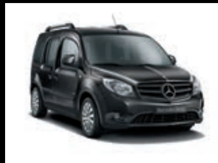
Černá dravit, metalíza MB 9398