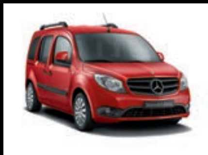
Červená amarena MB 3273